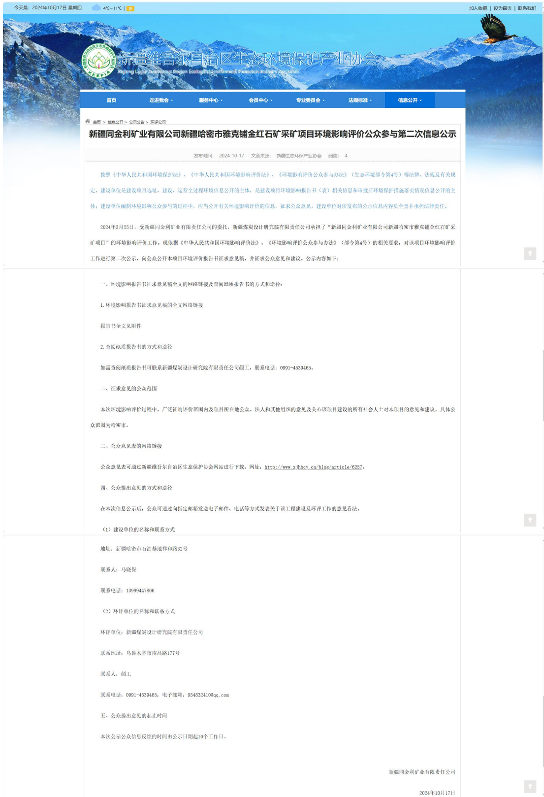
图 3-1 征求意见稿网上公示截图