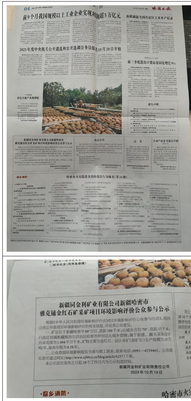
图 3-2 项目第一次登报公示截图

在征求意见稿网络公示的同时，在哈密日报进行了两次登报公示。哈密日报是项目所在区覆盖面较大的一张报纸，选择该报纸符合《办法》中规定要求。本次两次登报公示日期分别为2024年10月19日和10月28日。第一次登报公示截图见图3-2，第二次登报公示截图见图3-3。