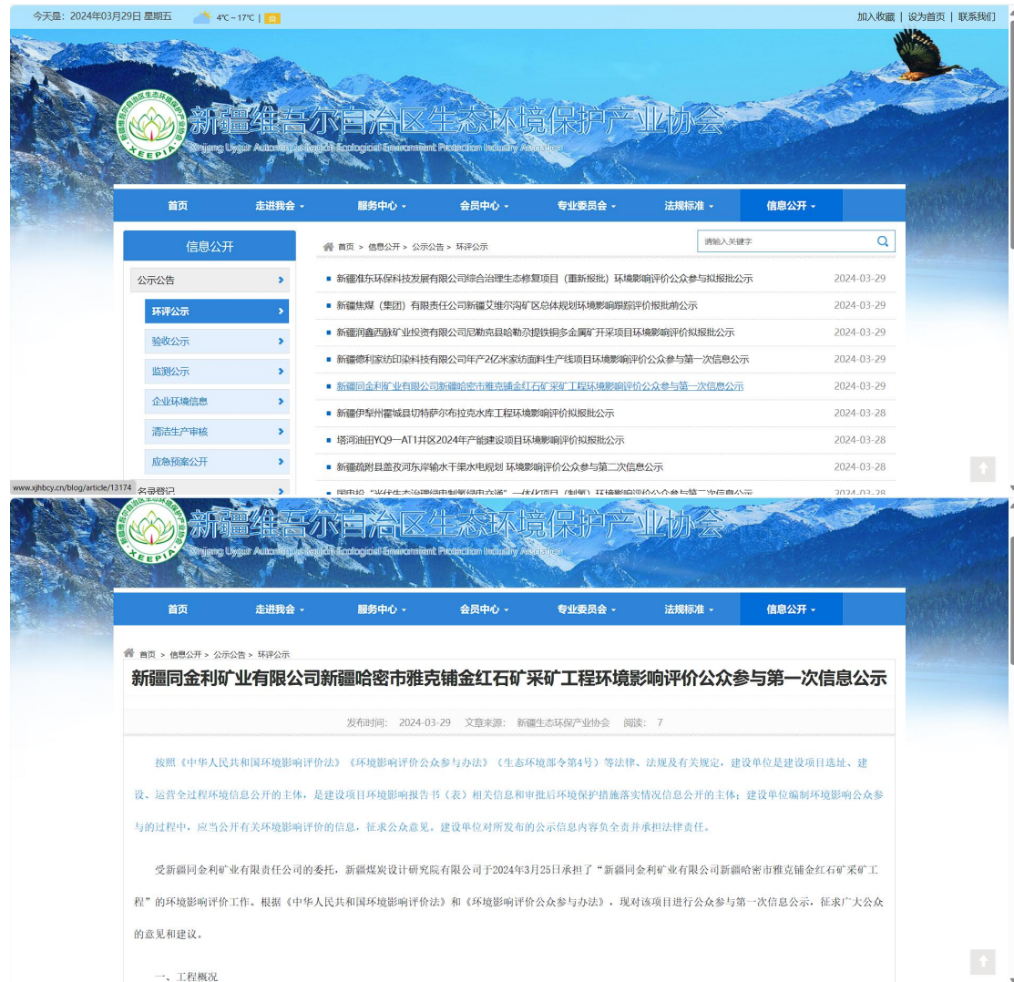
图 2-1 第一次公众参与网络公示截图

红石矿采矿项目环境影响评价公参与第一次信息公示》，在该官网发布本项目环评信息公示，符合《办法》中规定要求。第一次公众参与网络公示截图详见图 2-1。