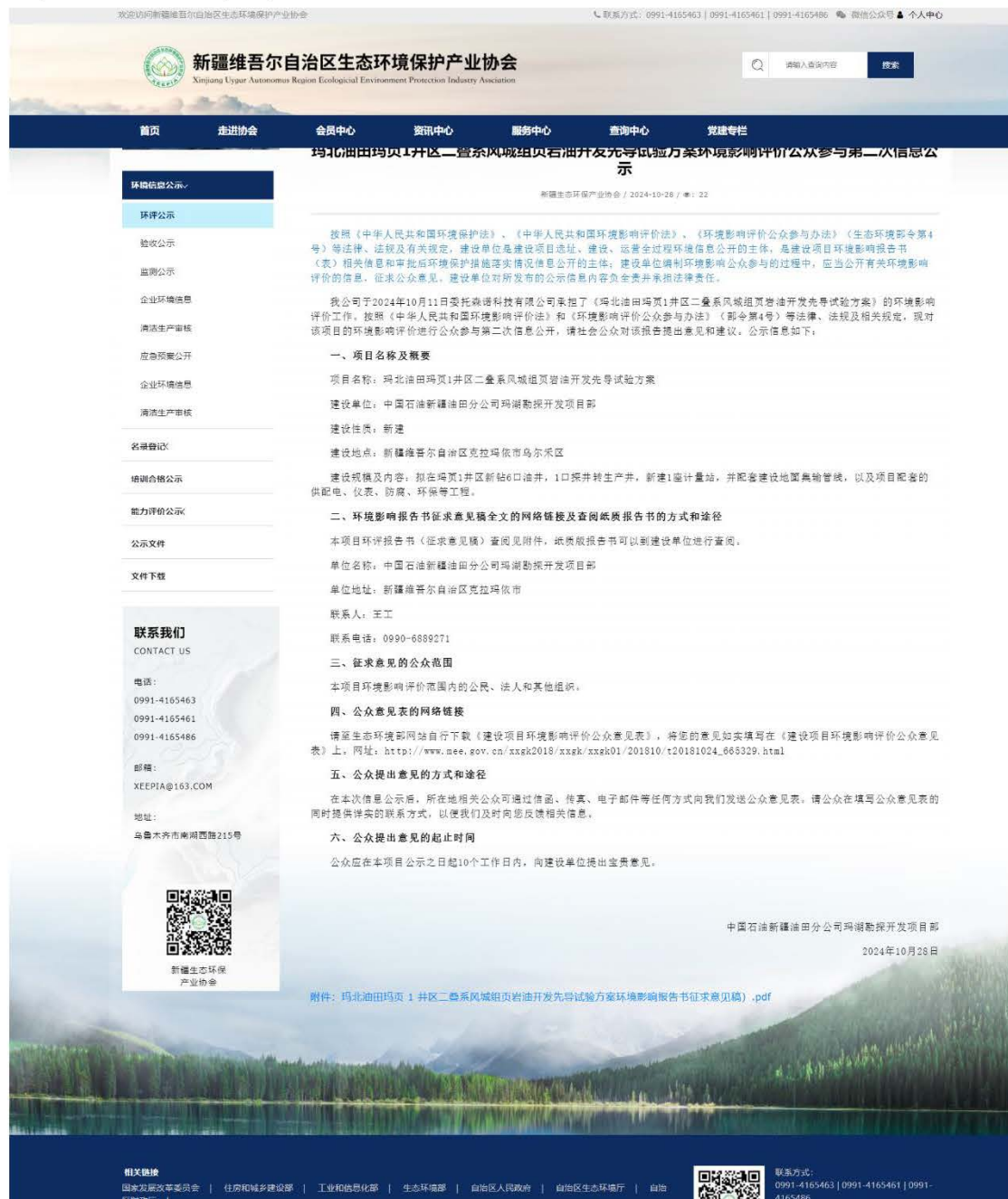
图 2 环境影响评价第二次信息网络公示截图

本项目环境影响报告书征求意见稿完成后，于2024年10月28日起在新疆维吾尔自治区生态环境保护产业协会官网（ http://www.xjhbcy.cn/ ）公开《玛北油田玛页1井区二叠系风城组页岩油开发先导试验方案环境影响报告书（征求意见稿）》，公开截图见图2。